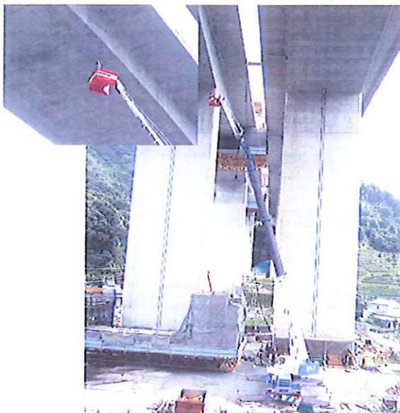
高速道 橋桁点検 40m作業 50Tラフター