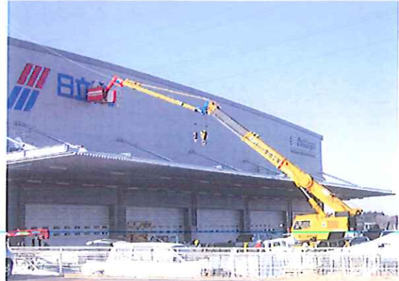
倉庫看板作業 半径20m 25Tラフター