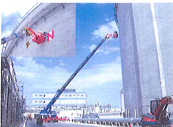
LNGタンク看板作業 半径25m 50Tラフター