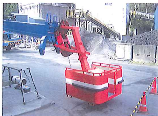
200T フルオートジブ取付

ボックスの外側は鋼板で囲い、高所における搭乗者の風よけと恐怖心を少なくしています