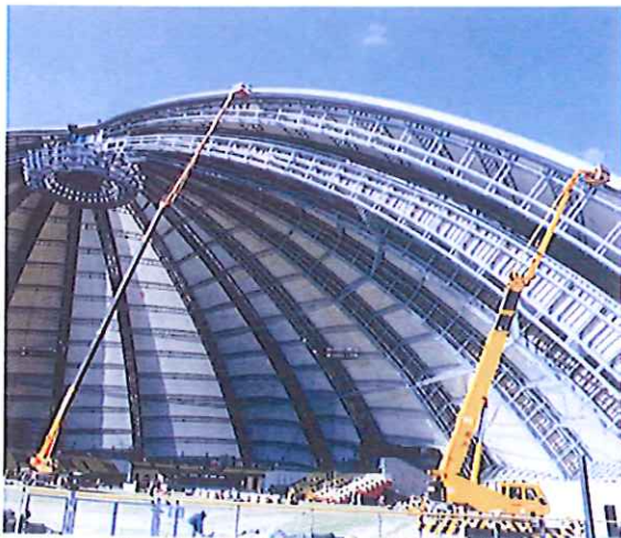
ドーム塗装 55m作業 50Tラフター