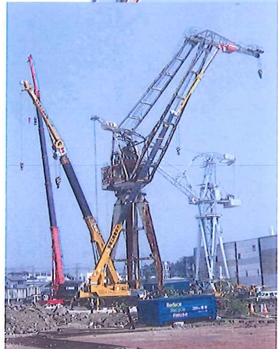
造船所クレーン解体 50m作業 50Tラフター