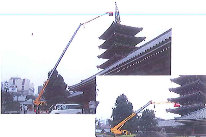
五重塔メンテナンス 50m作業 60Tラフター