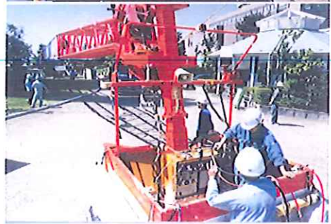
100m観音像リニューアル 100m作業 300Tクレーン