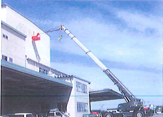
倉庫看板作業 半径30m 50Tラフター