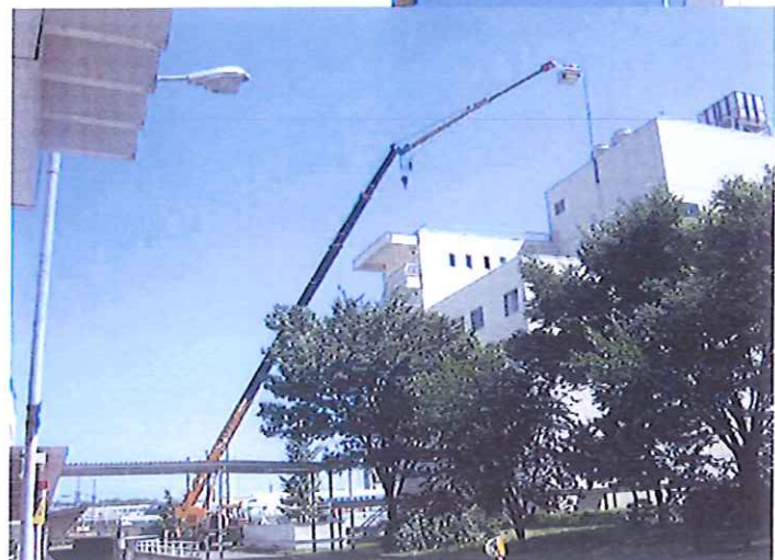
ビル避雷針交換 半径30m作業 50Tラフター