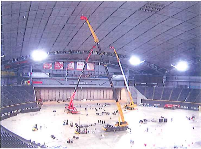
ドーム内 コンサート会場設営 60m作業 120Tクレーン